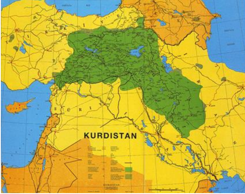
Hayali “Büyük Kürdistan” haritası.

“Büyük Kürdistan” haritalarına göz atıldığında yine Türkiye’nin Doğu ve Güneydoğu bölgelerinin tamamı, Akdeniz Bölgesinin Doğu ucu, Suriye’nin Kuzey kesimleri, Irak’ın Kuzeyi ve İran’ın Batı tarafları bu hayali haritanın içinde olduğu anlaşılacaktır.