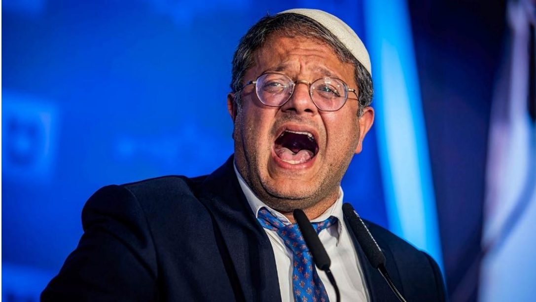
İsrail Ulusal Güvenlik Bakanı Itamar Ben-Gvir

İsrail Ulusal Güvenlik Bakanı Itamar Ben-Gvir bakanlar kurulu toplantısında "Kadın ve çocukların sınıra yaklaşmasına izin veremeyiz, yaklaşan herkes kafasına bir kurşun yemeli" dedi.