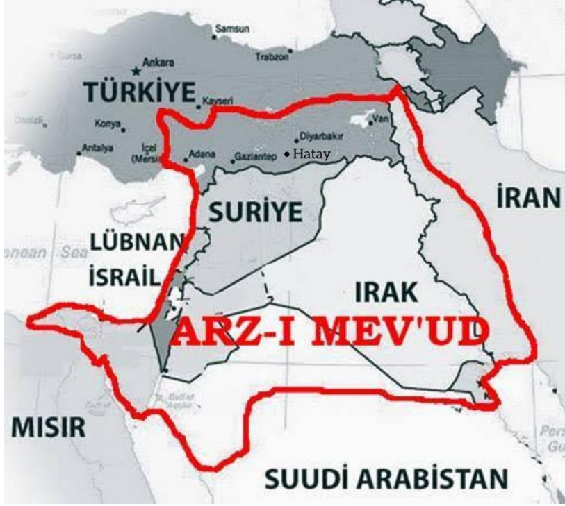
Hayali "Büyük İsrail" haritası.

2. Aynı toprakları ele geçirmek ve "büyük" devletler inşa etmek üzere büyük hayaller kuran bu üç ideolojiyi savunanlar da normal ve mantıklı şartlarda düşünüldüğünde, birbirleriyle "rakip" veya "düşman" olmaları gerekirken, tam aksine üçü de birbirlerini destekliyorlar ve birbirlerinin en sıkı dostlarıdır.